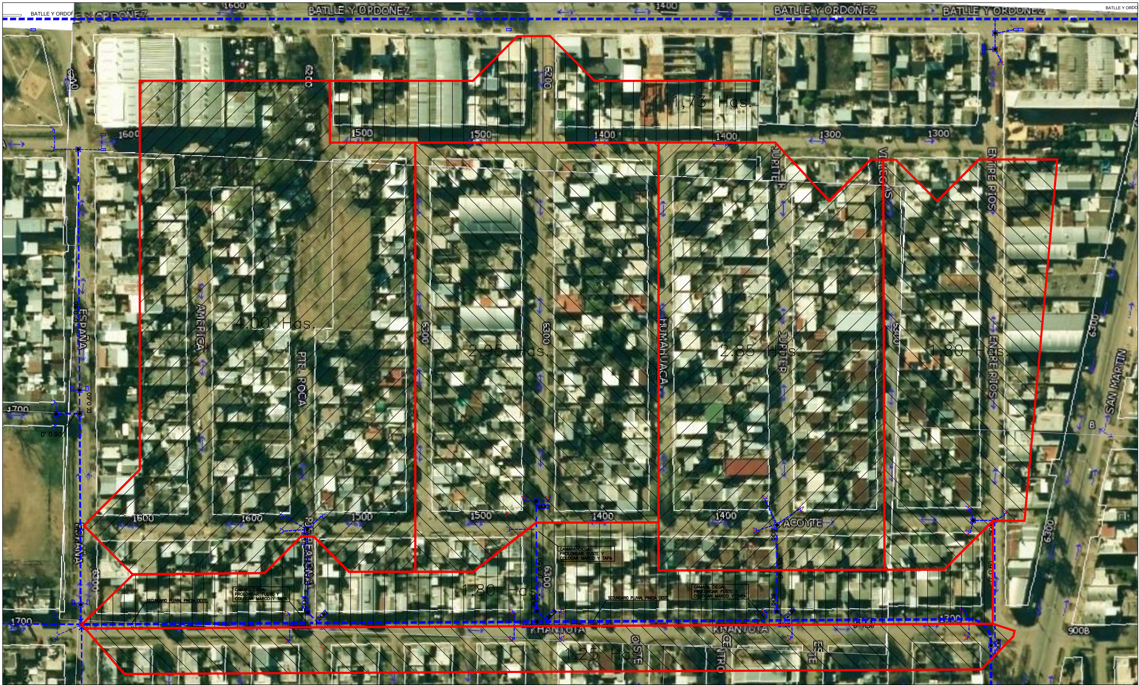
CROQUIS DE UBICACION